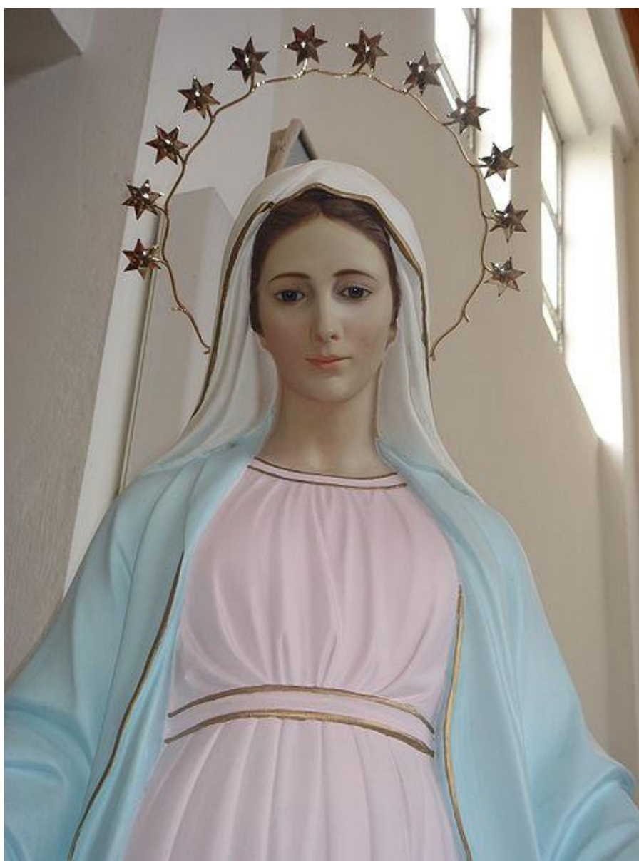
"Gospa" - figurka Matki Bożej w Tihaljinie k. Medjugorie

Pierwsze objawienie dzieciom miało mieć miejsce 24 czerwca 1981 roku we wsi Bijakovici, na wzgórzu Crnica należącym do parafii Medjugorie, w części tego wzgórza zwanej Podbrdo. Następnego dnia dzieci wróciły na to samo miejsce, dwoje z nich nie przyszło, a w zamian za nich przyszło dwoje innych. Tego dnia, tj. 25 czerwca 1981 roku, ukształtowała się szóstka tzw. widzących . Następnego dnia (26 czerwca) ukazująca się dzieciom Pani (w języku chorwackim: Gospa ) miała przedstawić się im jako Królowa Pokoju (chorw. Kraljica Mira ) Osoby mające wizje twierdzą, iż mają je do dziś.