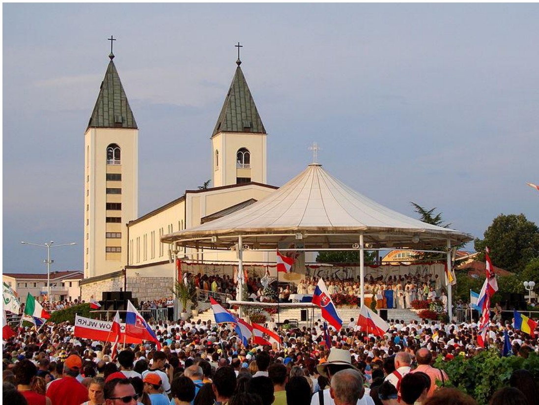
Festiwal w Medjugorie

Medjugorie to znane i odwiedzane miejsce pielgrzymkowe w Europie. Jest ośrodkiem odnowy życia religijnego. W centrum miejscowości znajduje się kościół pw. św. Jakuba . W Medjugorie istnieje ponadto dom duszpasterstwa osób uzależnionych - Wspólnota Cenacolo . Mieszczą się tutaj także domy różnych wspólnot: Wspólnoty Błogosławieństw, Oazy Pokoju i innych. W pobliżu miejscowości znajdują się dwa wzgórza - Wzgórze Objawień (Podbrdo), miejsce pierwszych objawień, oraz Wzgórze Krzyża ( Križevac ). Zbocza wzgórz są kamieniste, porośnięte niską roślinnością . W miejscach objawień ustawiono krzyże . Wokół, w rozpadlinach skalnych stoją liczne mniejsze krzyże, do których przymocowane są obrazki lub kawałki papieru z obietnicami, prośbami pielgrzymów, różańce i kwiaty.